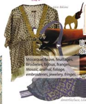
ÉCHOS DU DÉSERT desert organics

Mosaïque, fauve, feuillages, broderies, bijoux, franges. Mosaic, animal, foliage, embroideries, jewelry, fringes.