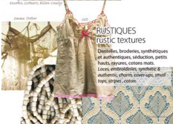
RUSTIQUES rustic textures

Dentelles, broderies, synthétiques et authentiques, séduction, petits hauts, rayures, cotons mats. Laces, embroideries, synthetic & authentic charm, cover-ups, small tops, stripes, coton.