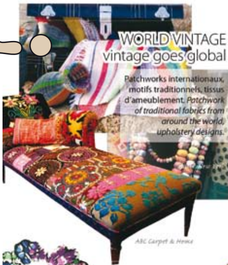
WORLD VINTAGE vintage goes global

Patchworks internationaux, motifs traditionnels, tissus d'ameublement. Patchwork of traditional fabrics from around the world, upholstery designs.