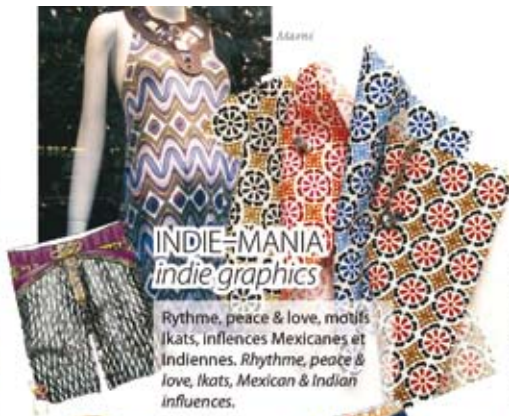
INDIE-MANIA indie graphics

Rythme, peace & love, motifs ikats, influences Mexicanes et Indiennes. Rhythm, peace & love, ikats, Mexican & Indian influences.