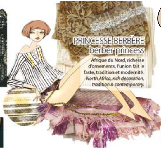
PRINCESSE BERBÈRE berber princess

Afrique du Nord, richesse d'ornements, l'union fait le faste, tradition et modernité. North Africa, rich decoration, tradition & contemporary.