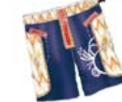
FOLKLORE ET CRAFT crafts & folklore

Bleus de Delft, rayures, esprit Hollandais, toile de Jouy. Delft blue, stripes, dutch costume inspirations, toiles de Jouy.